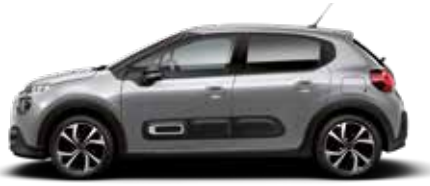
Steel Grey (metallic)