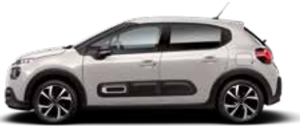
Soft Sand (parelmoer)