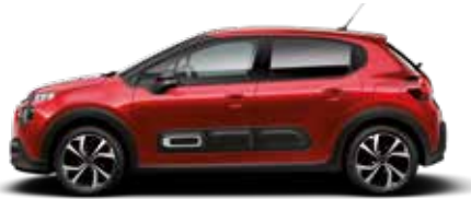
Elixer Red (parelmoer)