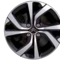
Lichtmetaal 17" Diamantée VECTOR 205/50 R17V

● = Standaard ○ = Optioneel - = Niet leverbaar