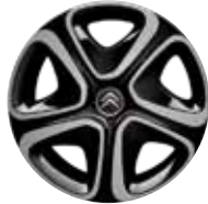
Staal 16" STEEL & STYLE 3D 205/55 R16V