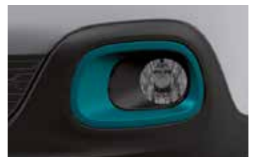
Pack Color Emerald