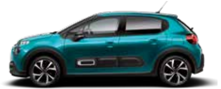
Spring Blue (parelmoer)