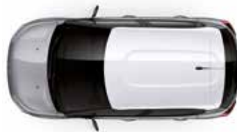
Two Tone Opal White