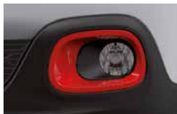
Pack Color Sport Red