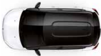
Two Tone Onyx Black