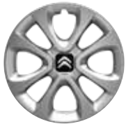
Staal 15" ARROW 185/65 R15H