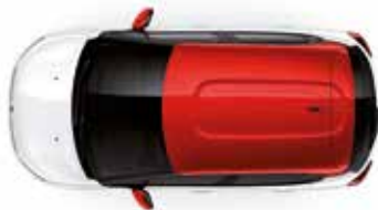
Two Tone Sport Red