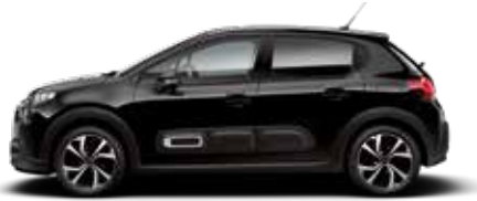
Perla Nera Black (parelmoer)