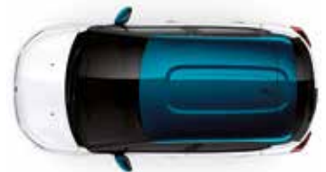
Two Tone Emerald