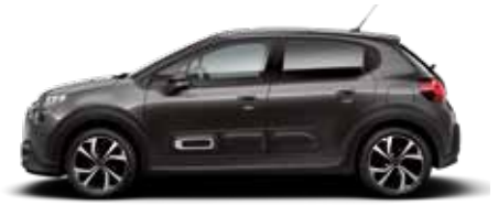
Platinum Grey (metallic)