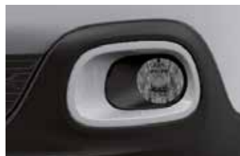
Pack Color Opal White