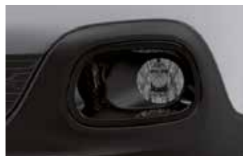
Pack Color Onyx Black